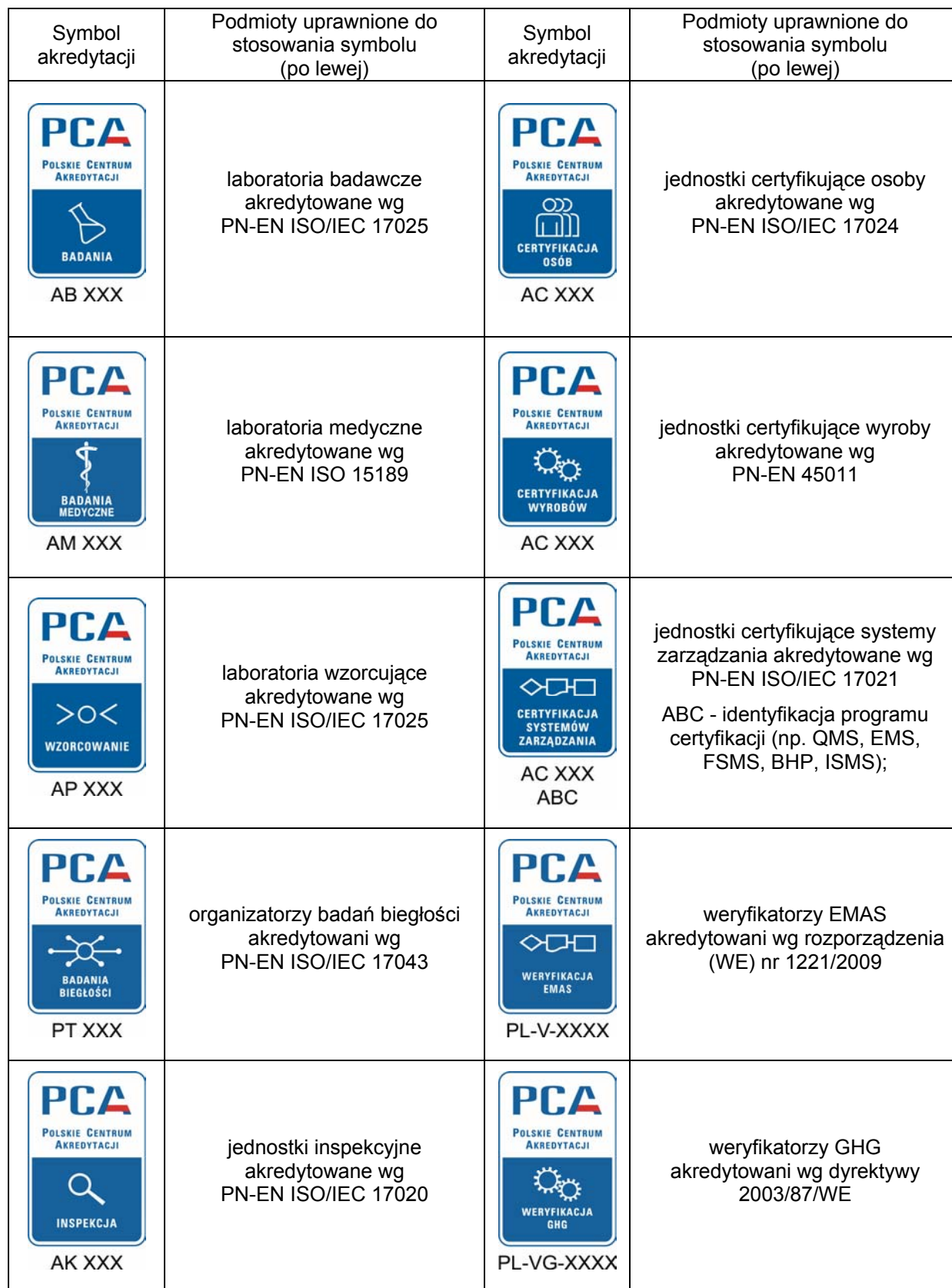
Tabela nr 1