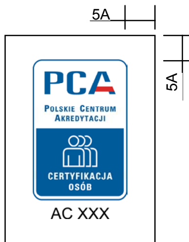
Rysunek 3. Pola ochronne symboli akredytacji PCA

3.8. Symbole akredytacji PCA posiadają barwy zdefiniowane poniżej: