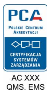
Rysunek 6. Przykład stosowania symbolu akredytacji: CERTYFIKACJA SYSTEMÓW ZARZĄDZANIA na certyfikatach dot. zintegrowanych systemów zarządzania lub na dokumentach i materiałach reklamowych, w przypadku posiadania przez jednostkę certyfikującą systemy zarządzania akredytacji w zakresie kilku programów certyfikacji