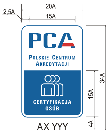
Rysunek 2. Proporcje wymiarów w symbolu akredytacji PCA 1

Zastosowanie wymiarów mniejszych niż podstawowe wymaga uzyskania pisemnej zgody PCA.