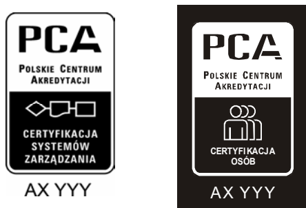
Rysunek 5. Przykłady czarno-białych wersji symboli akredytacji PCA