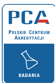
Rysunek 7. Przykład stosowania symbolu w przypadku posiadania przez organizację kilku odrębnych akredytacji dla laboratoriów badawczych